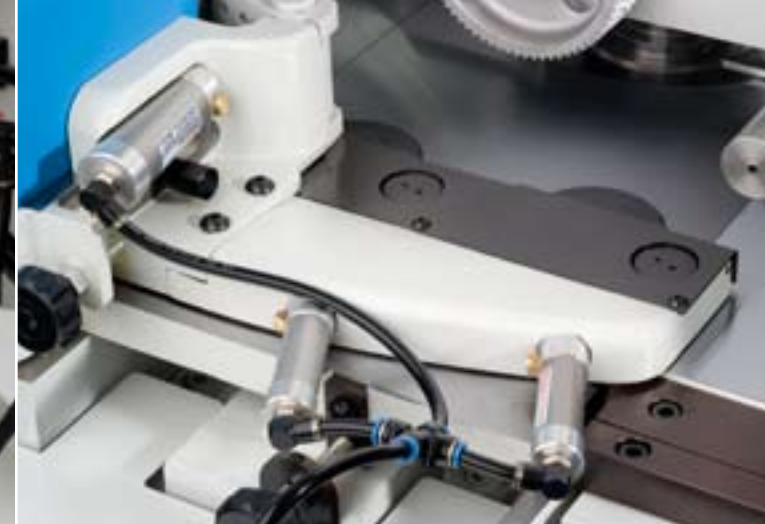
Outboard bearing Steunlager